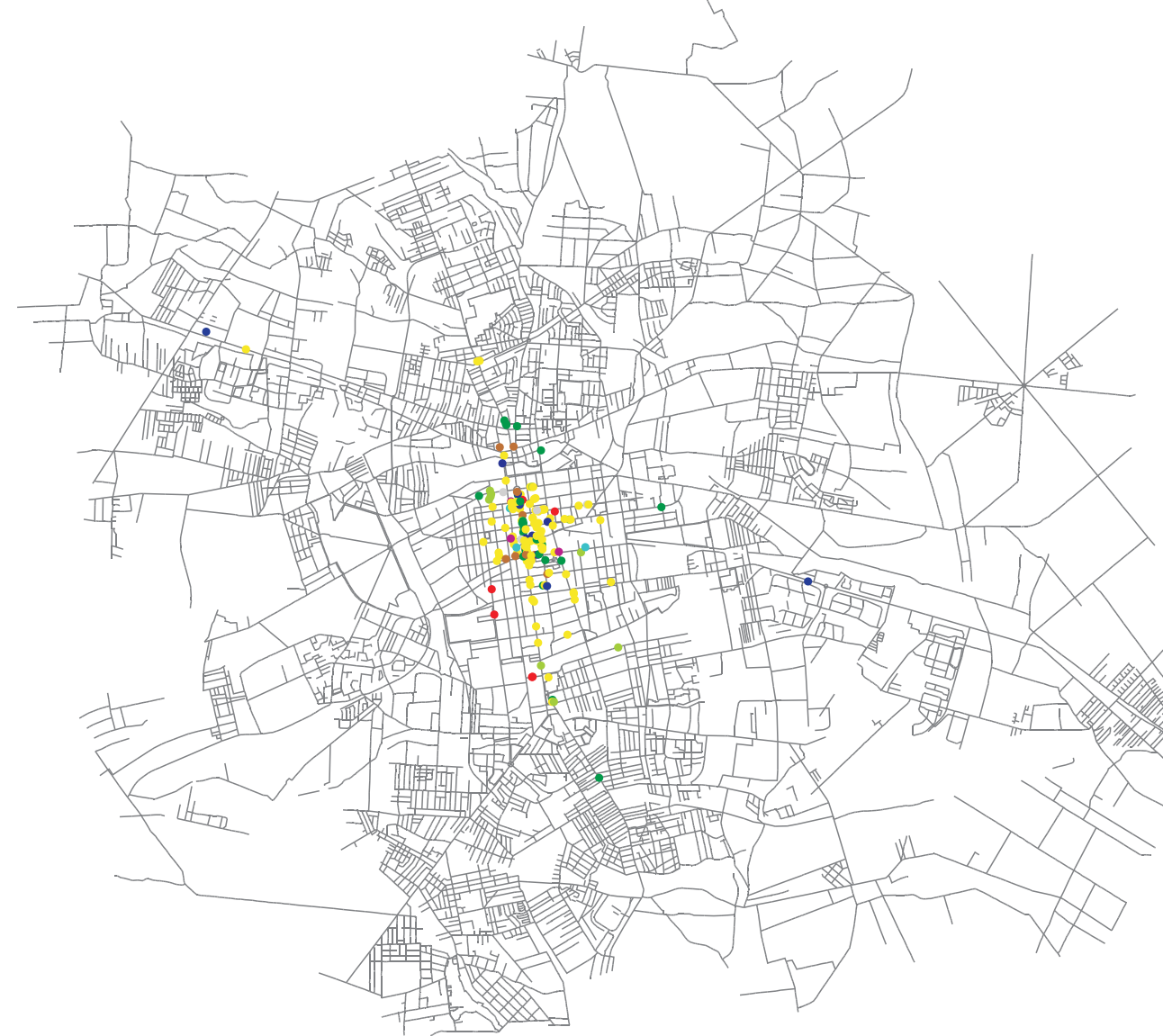
2. INSTYTUCJE METROPOLITALNE ŁODZI W 1919 R.