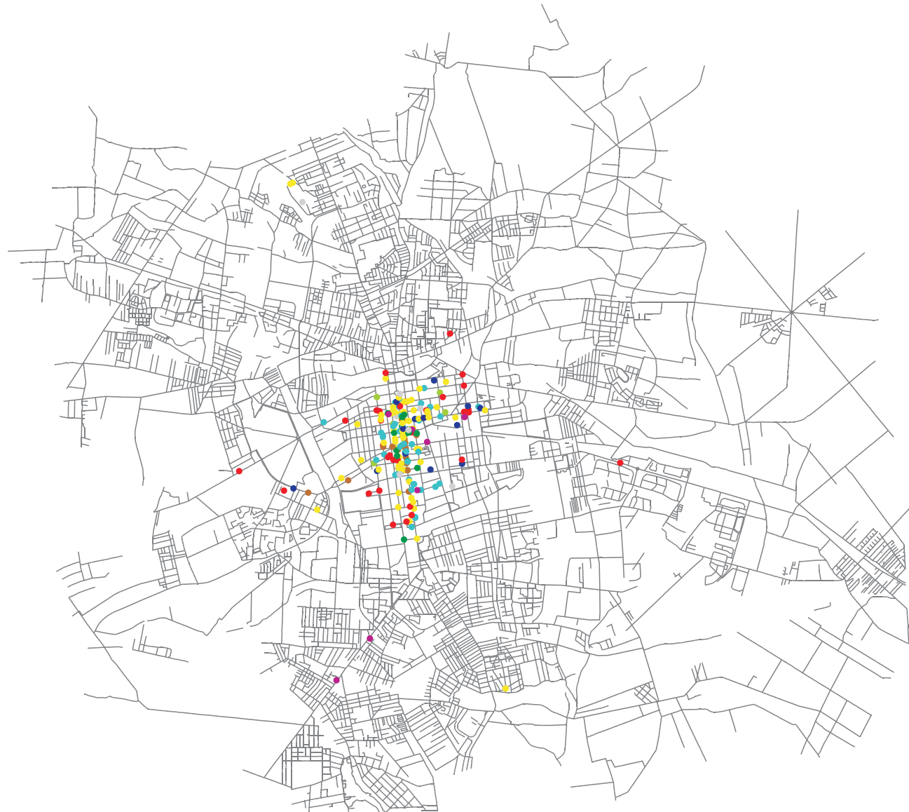
4. INSTYTUCJE METROPOLITALNE ŁODZI W 1945 R.