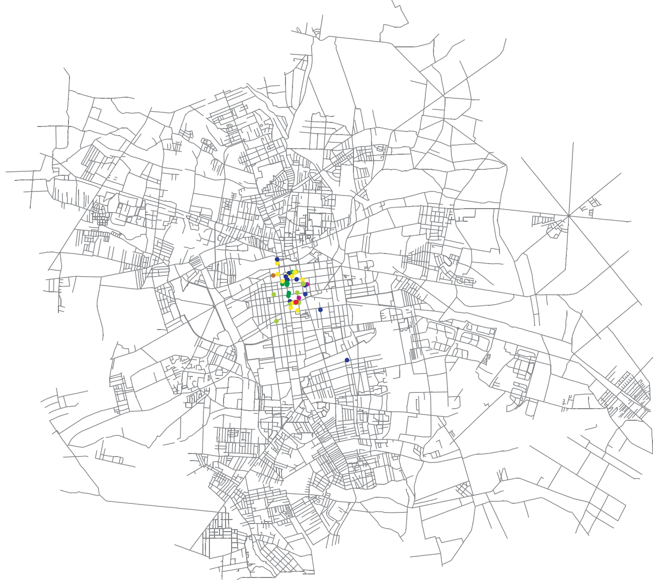
1. INSTYTUCJE METROPOLITALNE ŁODZI W 1891 R.