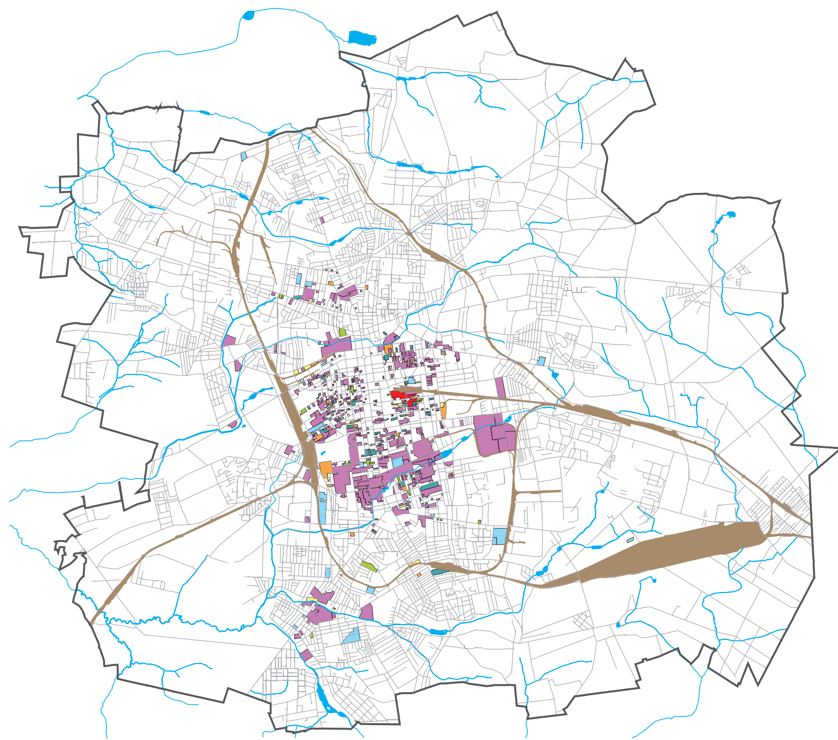
1. Rozmieszczenie terenów przemysłowych Łodzi w 1938 roku